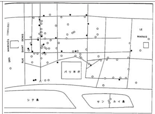
図2 尊属(●)を持つノルマンディー地方出身の商店主(○)(1840年頃)

[出所] YAOUANQ, J. L., "Parenté, mariage, fécondité : Quelques aspects de l'immigration normande dans la première moitié du XIX e siècle", Ethnologie française , vol.10, no.2, 1980, pp.147, 149より作成。